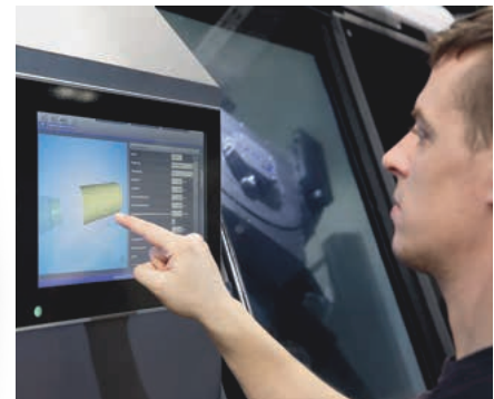
Einfache Hand- und Fernbedienung

Der zusätzliche Platzbedarf über die Maschinenmaße hinaus ist gering, da ein vorgesehener Späneförderer unter der Automation platziert werden kann.